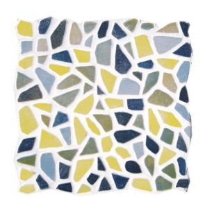
SAVOIA GEMME del GOLFO S5237 Multicolor