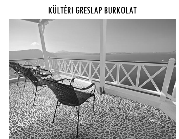
KÜLTÉRI GRESLAP BURKOLAT